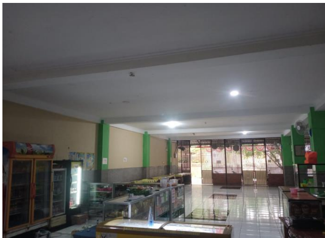
Gambar 4. 1 Kantin Universitas Sali Al-Aitaam

Penelitian ini dilaksanakan di Kantin Universitas Sali Al-Aitaam yang berlokasi di Jalan Aceng Sali, Kampung Ciganitri, Desa Cipagalo, Kecamatan Bojongsoang, Kabupaten Bandung, Jawa Barat. Kantin ini merupakan salah satu fasilitas penting yang menunjang aktivitas harian sivitas akademika, khususnya mahasiswa sebagai pengguna layanan utama. Selain menyediakan makanan dan minuman, kantin juga menjadi ruang interaksi sosial yang dinamis, tempat mahasiswa beristirahat, berdiskusi, bahkan mengerjakan tugas.